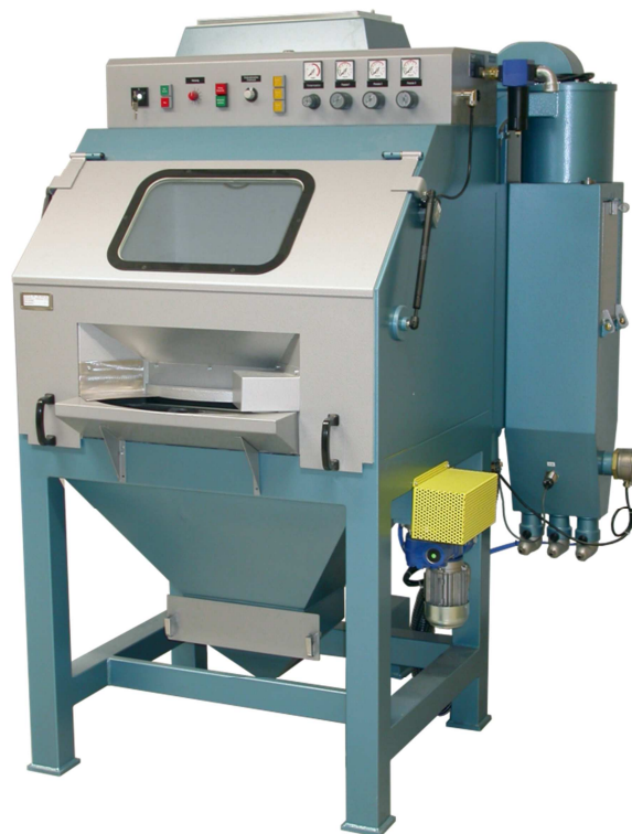
Abbildungen können Zubehör und / oder Spezialausführungen enthalten