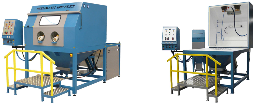
Abbildungen können Zubehör und / oder Spezialausführungen enthalten